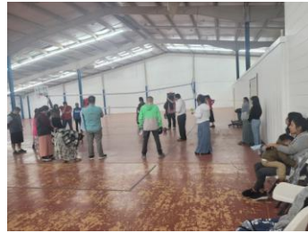
Tiempo familiar como iglesia