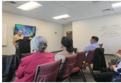
Reunión anual del Staff MGMI en Carolina del Sur