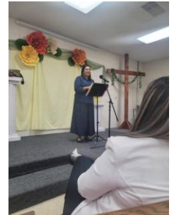
Reunión de Damas Berea en Carolina del Sur