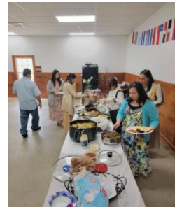
Día de Madres