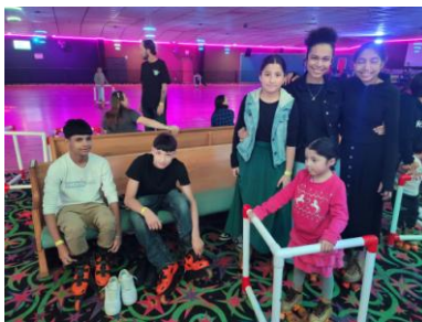
Tiempo con los jóvenes